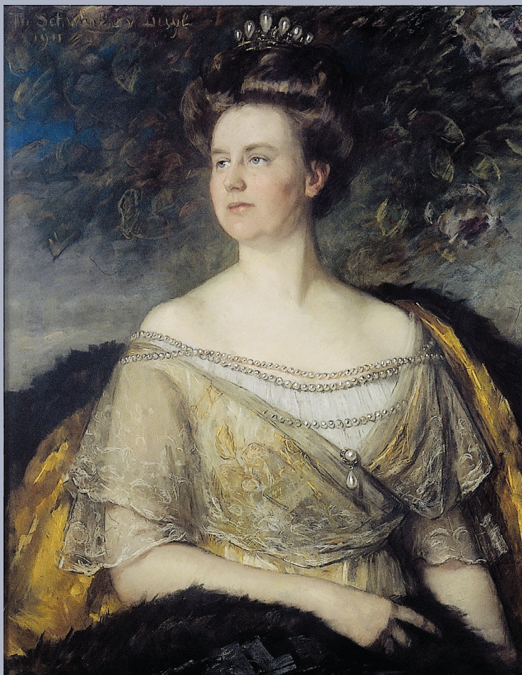
Portret van Koningin Wilhelmina, Thérèse Schwarzte, pastel op papier